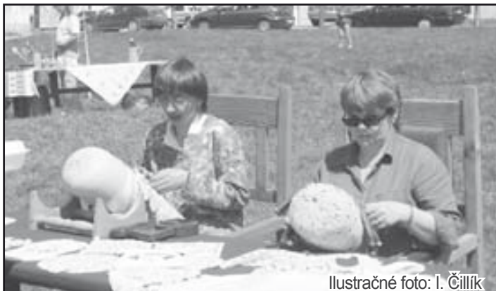
Ilustračné foto: I. Čillík