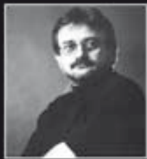
AFORIZMY STANA RADIČA

☺ Nejedno rodičovské združenie sa zmení na rodičovské vzrušenie.