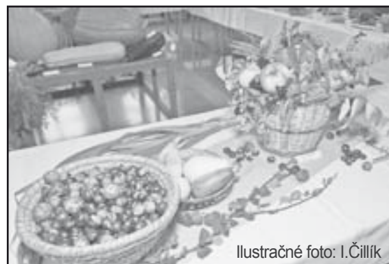
Ilustračné foto: I.Čillík