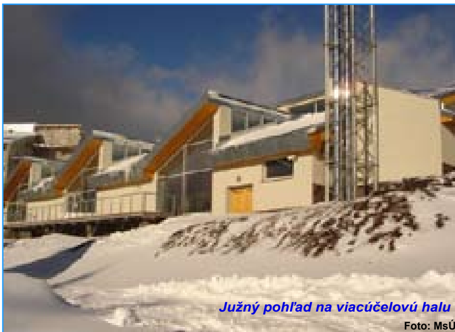
Južný pohľad na viacúčelovú halu