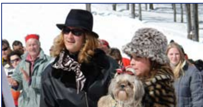
...a že Mojsejovci neprídu na každé podujatie! ???...