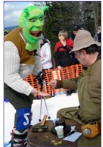
...razilo sa o 107...