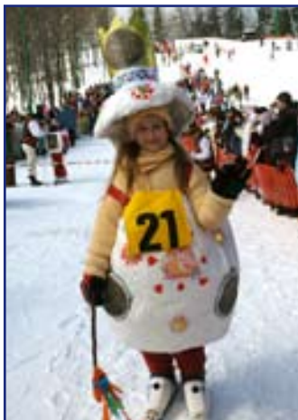
...masky v deťskej kategórii boli naozaj úžasné, preto táto tradícia nemôže zaniknúť ani náhodou...