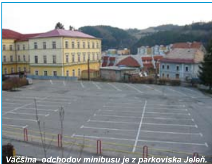
Väčšina odchodov minibusu je z parkoviska Jeleň.

Zima sa končí, lyže pomaly zavesíme na klince, a preto prichádza zmena aj v cestovnom poriadku miestneho minibusu. Ten pre záujemcov o lyžovačku – ako turistov, tak občanov mesta – počas celej lyžiarskej sezóny zabezpečovalo mesto Kremnica. V snahe uspokojiť obyvateľov odľahlejších dolín mesta, od februára začal fungovať spoj aj na tieto miesta, a to v pondelok, stredu a v piatok v raňajších a popoludňajších hodinách. V čase, keď rušíme skibus, hľadáme najlepší model fungovania miestneho minibusu. Pri našich rozhodnutiach sú prvorade potreby a požiadavky obyvateľov, samozrejme pri maximálnej