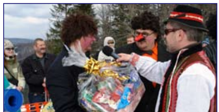
...ocenenie maskám patrilo za ich ochotu pobaviť iných...