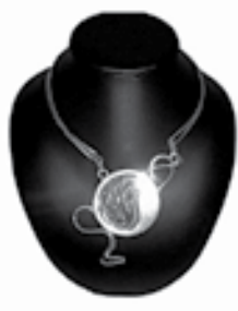
E.Grniaková - MMM

Výstava je prístupná od 1. do 29. apríla 2008.