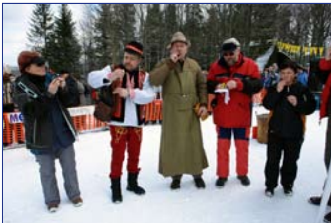
...na začiatku sa pripilo, ako sa na vajci patrí - z vajca...