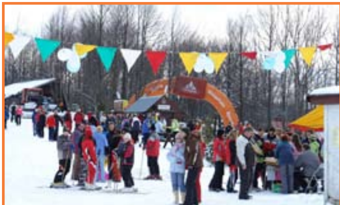
Stretneme sa na 48. ročníku karnevalovej rozlúčky so snehom s novou menou a novými nápadi.