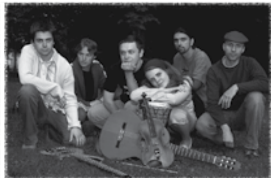
Tešíme sa na spoločné stretnutie pri dobrej hudbe.

dňa 26. apríla 2008 (sobota) v KINE AKROPOLA. Host'om festivalu je skupina HRDZA.