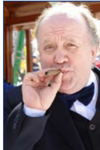
...boli aj „bankári“