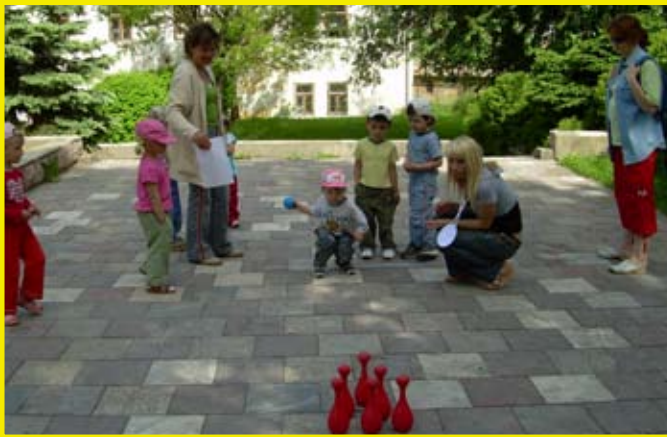
... kolky boli náročné, ale sme sa triafali...

Deň detí bol naozaj vydarený a vďaka krásnemu počasiu deti prežili pekné chvíle. K ich radosti prispeli aj sponzori Slovenská sporiteľňa, a.s. a COOP Jednota.