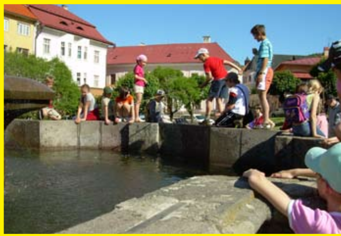
... pri slniečku sa nám dobre čvachtalo vo fontáne...