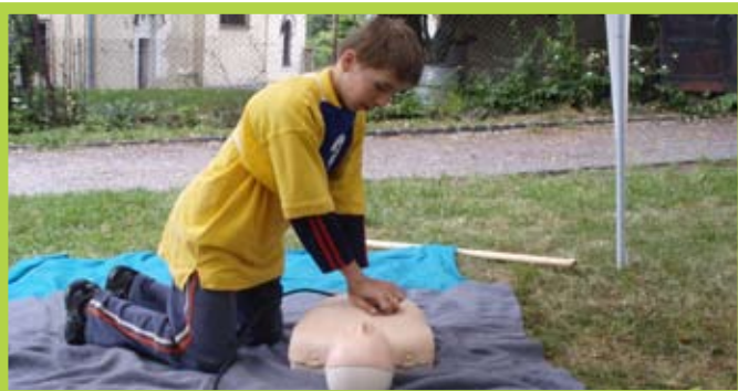
... ako oživujem, tak oživujem, veď už naskoč!...