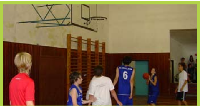
... basketbal nás bavil, aj keď sme boli nižší...