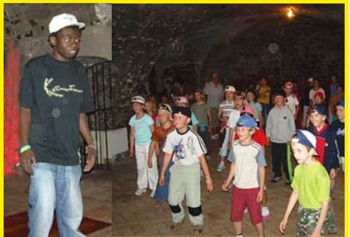
... EDY to teda s nami HIP - HOPOVAL...

Detská olympiáda - za účasti detí z Nového Jičína a Herbolzheimu. Zmerali si sily, zabavili sa a tešia sa na olympiádu, ktorá bude v Novom Jičíne.