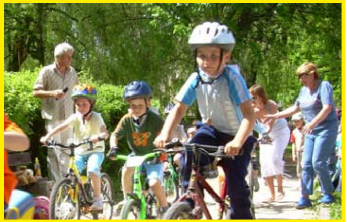
...ó, bycikel to je naše...