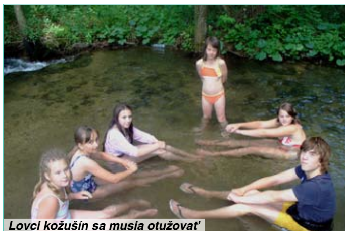
Lovci kožušín sa musia otužovať