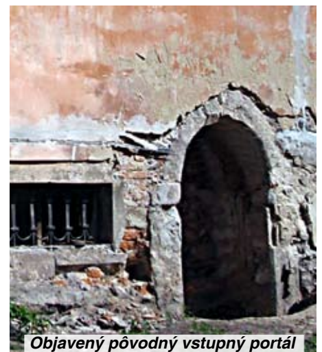
Objavený pôvodný vstupný portál