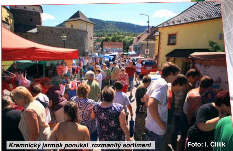
Kremnický jarmok ponúkal rozmanitý sortiment