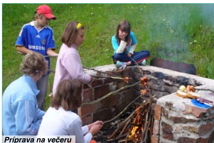
Príprava na večeru