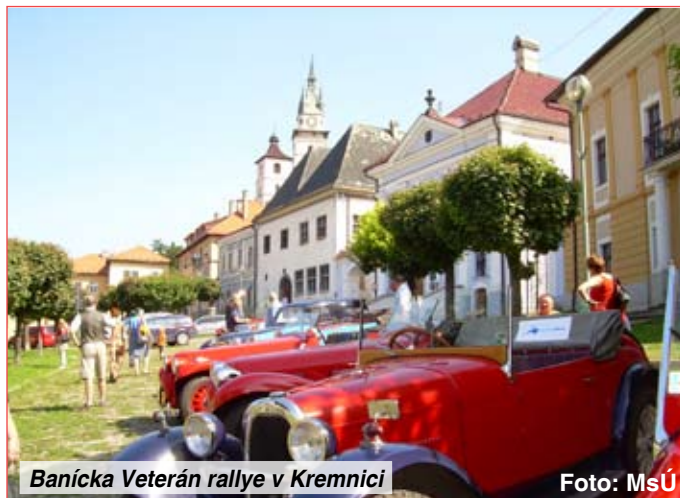
Banická Veterán rallye v Kremnici