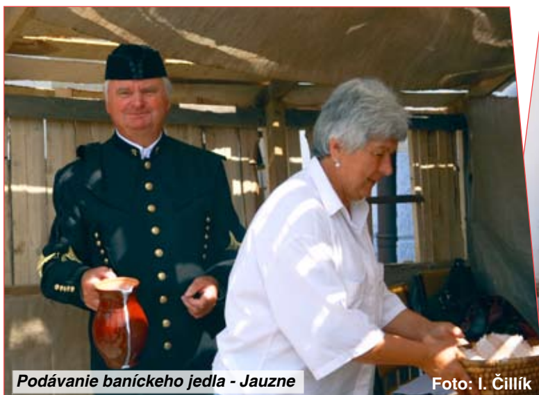
Podávanie banického jedla - Jauzne