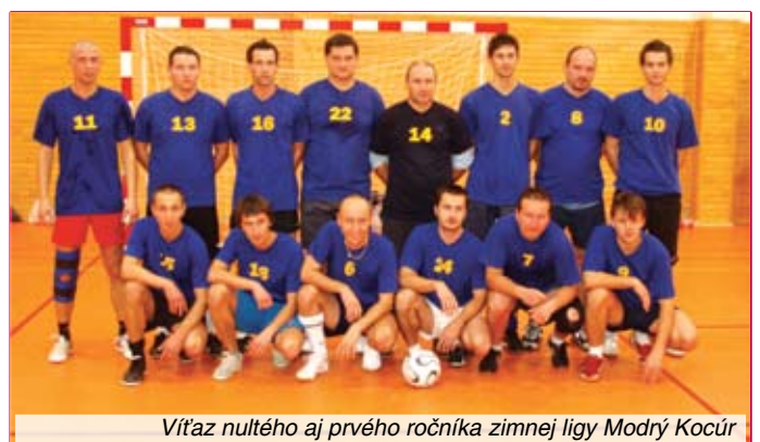
Vítaz nulého aj prvého ročníka zimnej ligy Modrý Kocúr