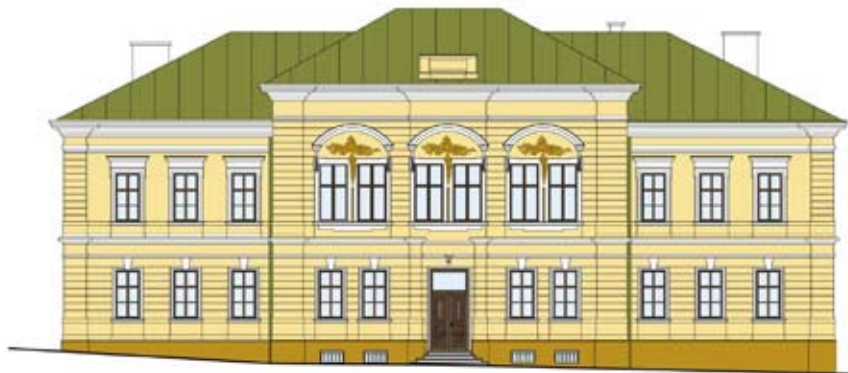
Schválený projekt predstavuje budovu v bežovom prevedení, s medenou strechou.

Po rekonštrukcii bude Mestské kultúrne stredisko opäť slúžiť svojmu účelu ako reprezentatívny kultúrny stánok Kremnice.