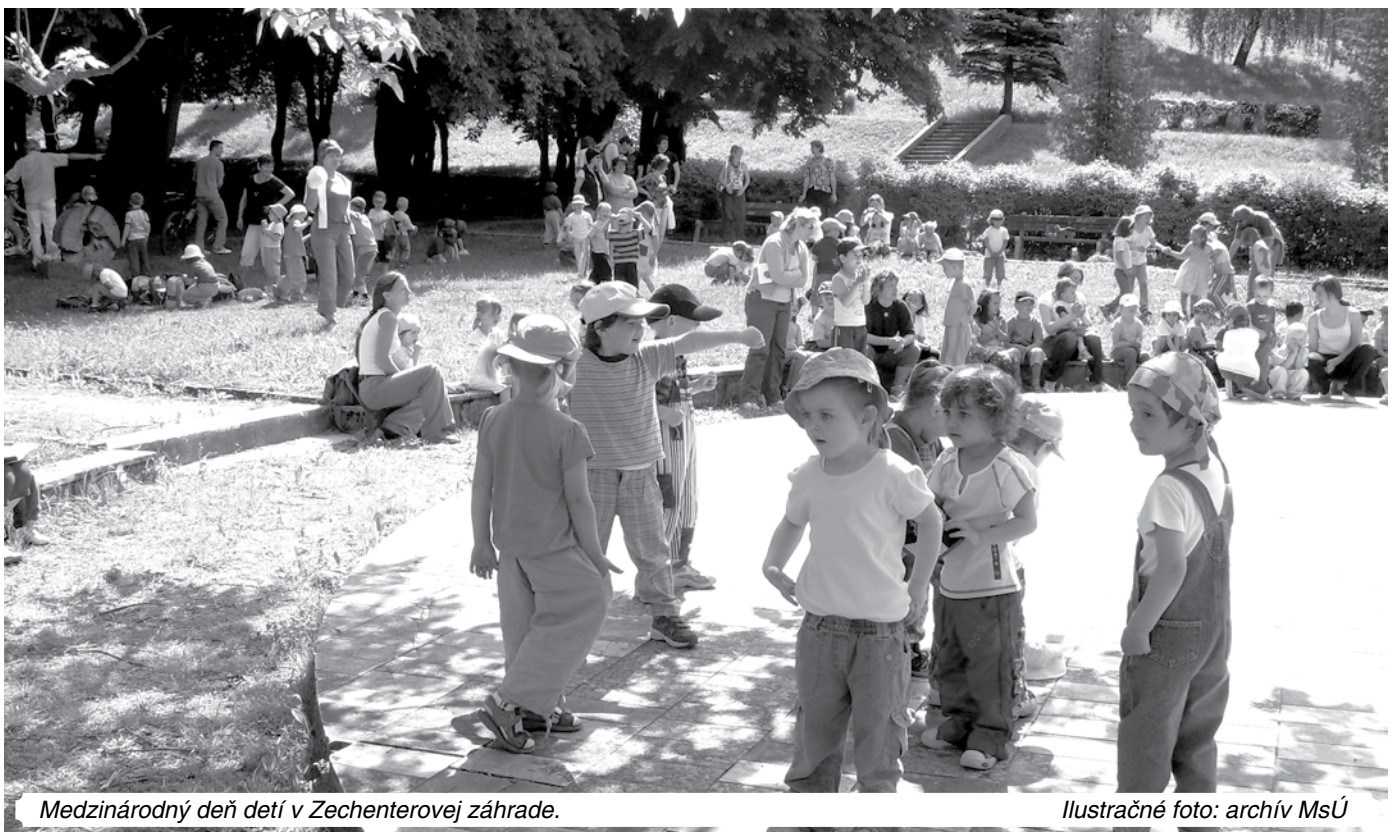
Medzinárodný deň detí v Zechenterovej záhrade.