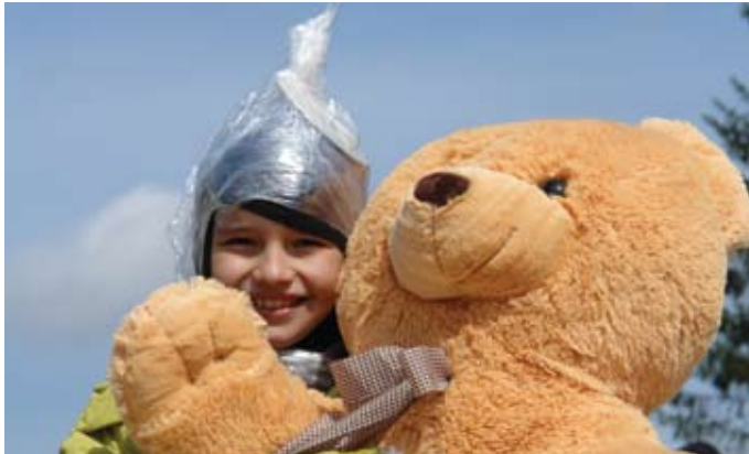
„Počítačový vírus“ - víťaz najmladšej kategórie