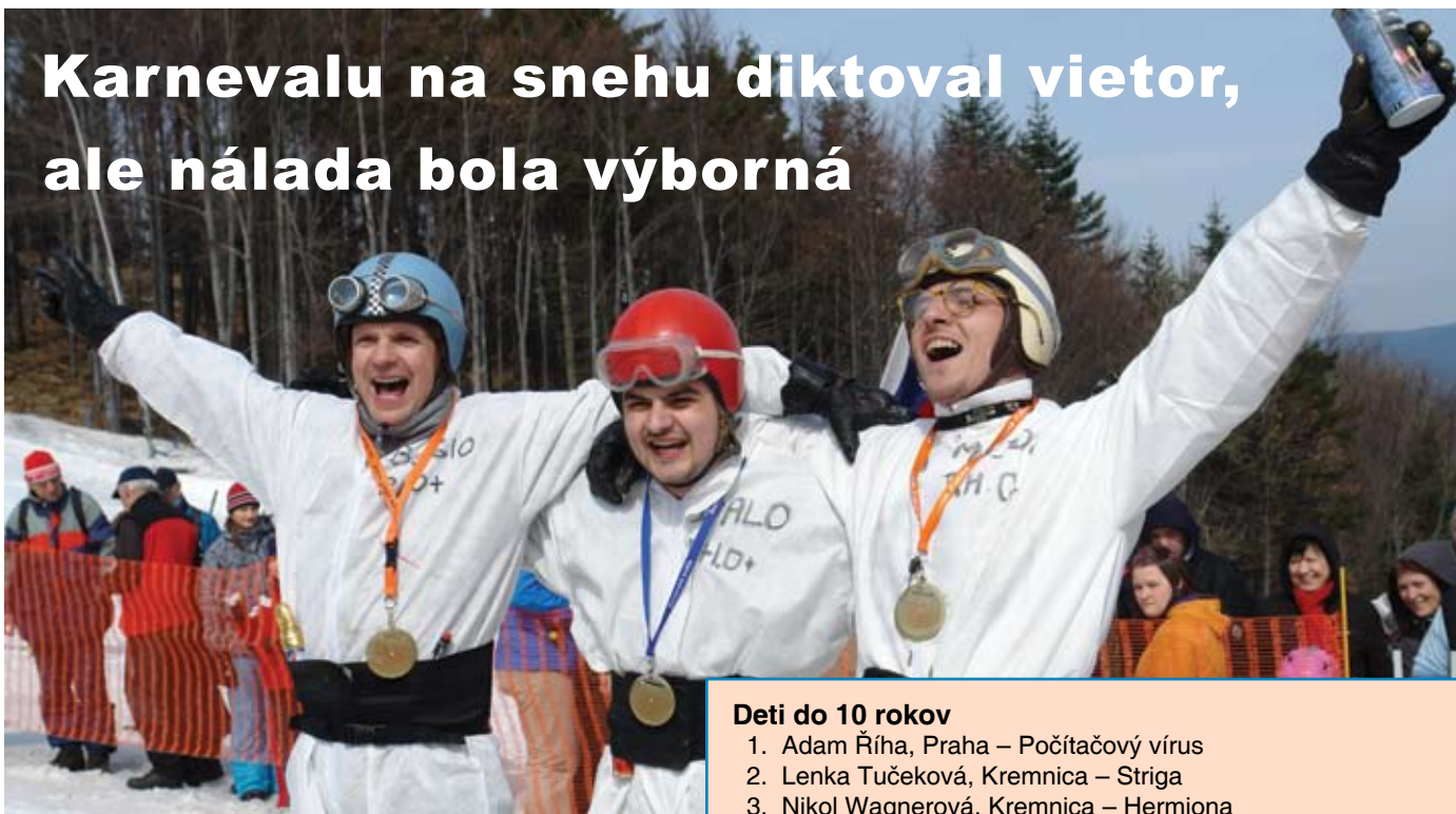
„Bobíci“ z Kremnice“