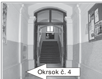
Okrskok č. 4

Štefánikovo námestie, Námestie SNP, Angyalova ulica, Bystrická ulica, Partizánska dolina, Ul. P. Križku, Ul. J. Kollára, Mesto Kremnica (bez určenia ulice a čísla domu)