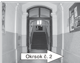
Okrskok č. 2

Zámocké námestie, Zlatá ulica, Továrenská ulica, Ul. J. Langsfelda, Štúrova ulica, Ul. Rumunskej armády, Kutnohorská ulica, Banská cesta, Nová dolina, Ul. J. Horvátha (čísla domov 860, 861, 862, 863, 871, 872, 878, 887, 888, 892, 893, 894, 896, 897, 898, 899, 900, 901, 912, 913, 916, 917, 918, 919, 920 a 922), Revolta