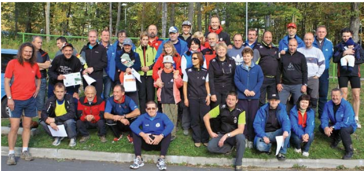
Organizátori, účastníci, víťazi – spoločné foto všetkých tých, ktorí sa podieľali na dobre zvládnutom podujatí.