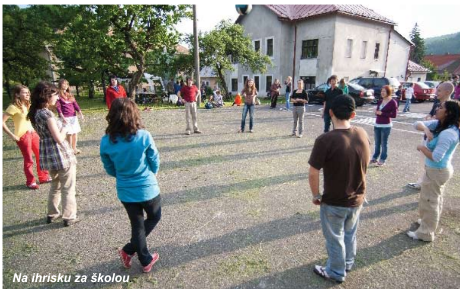
Na ihrisku za školou.

Pred šesťdesiatimi rokmi, presne 18. októbra 1950, vznikol Mestský hudobný ústav, v ktorom sa začali hudobne vzdelávať mladí ľudia Kremnice. Z tejto inštitúcie postupne, rôznymi štátnymi úpravami, vznikala dnešná Základná umelecká škola Jána Levoslava Bellu, ktorá má v súčasnosti 4 umelecké odbory: hudobný, výtvarný, tanečný a literárno-dramatický. V týchto umeleckých odboroch sa vo výročnom školskom roku 2010/2011 umením a k umeniu bude vzdelávať 350 žiakov od 4 – 7 rokov v prípravnom štúdiu, od 7 – 14 rokov v I. stupni základného štúdia, od 15 – 19 rokov v II. stupni základného štúdia a od 20 rokov v kurze pre dospelých.