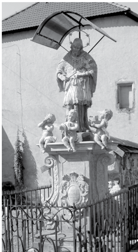
Po dvoch rokoch sa sochy svätca Jana Nepomuckého vrátili na svoje pôvodné