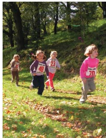
V stredu 23. septembra pretekali škôlkári.