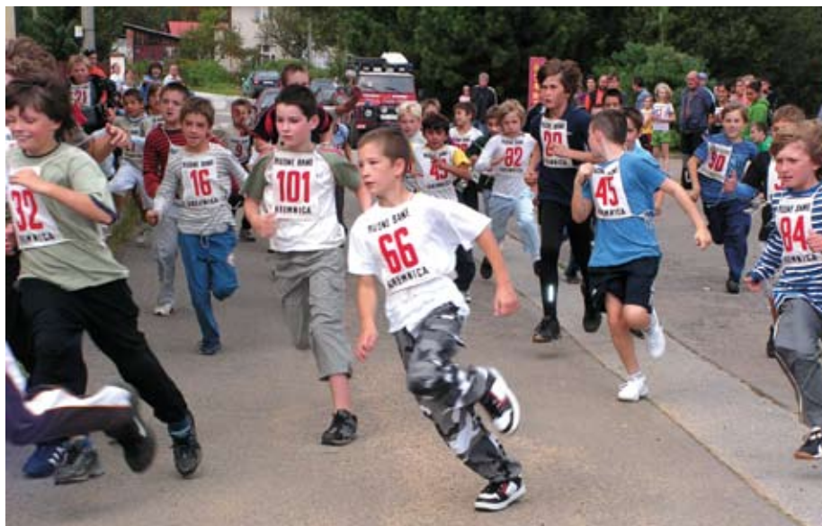
Štart najpočetnejšej kategórie mladších žiakov na parkovisku pred budovou riaditeľstva KBS.