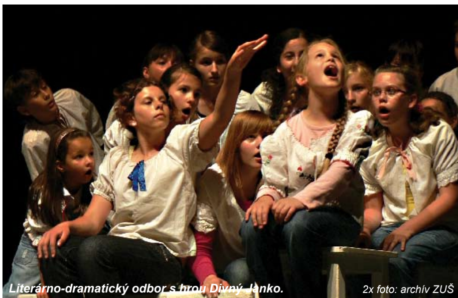
Literárno-dramatický odbor s hrou Divný lanko.

Slávnostný koncert k 60. výročiu založenia ZUŠ J. L. Bellu v Kremnici sa uskutoční 22. októbra 2010 v Kostole sv. Kataríny o 17.00 hod. Pozývame vás.