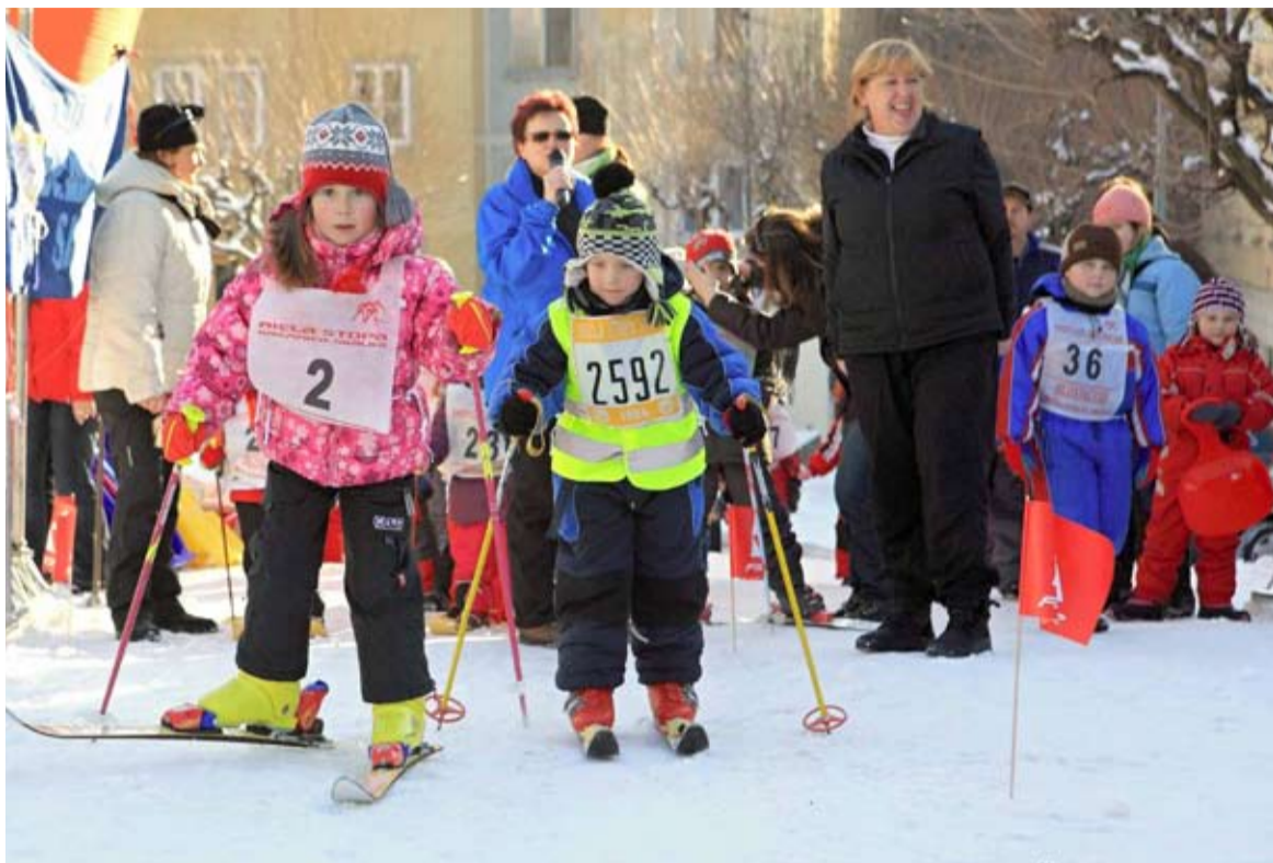
Deti materskej školy v Kremnici si v piatok 28. 1. 2011 zasúť'ažili v Mini Bielej stope na Štefánikovom námestí. Vo večerných hodinách sa v tých istých miestach na umelo upravenom okruhu okolo fontány a Stĺpa sv. Trojice konali mestské bežecké šprinty.