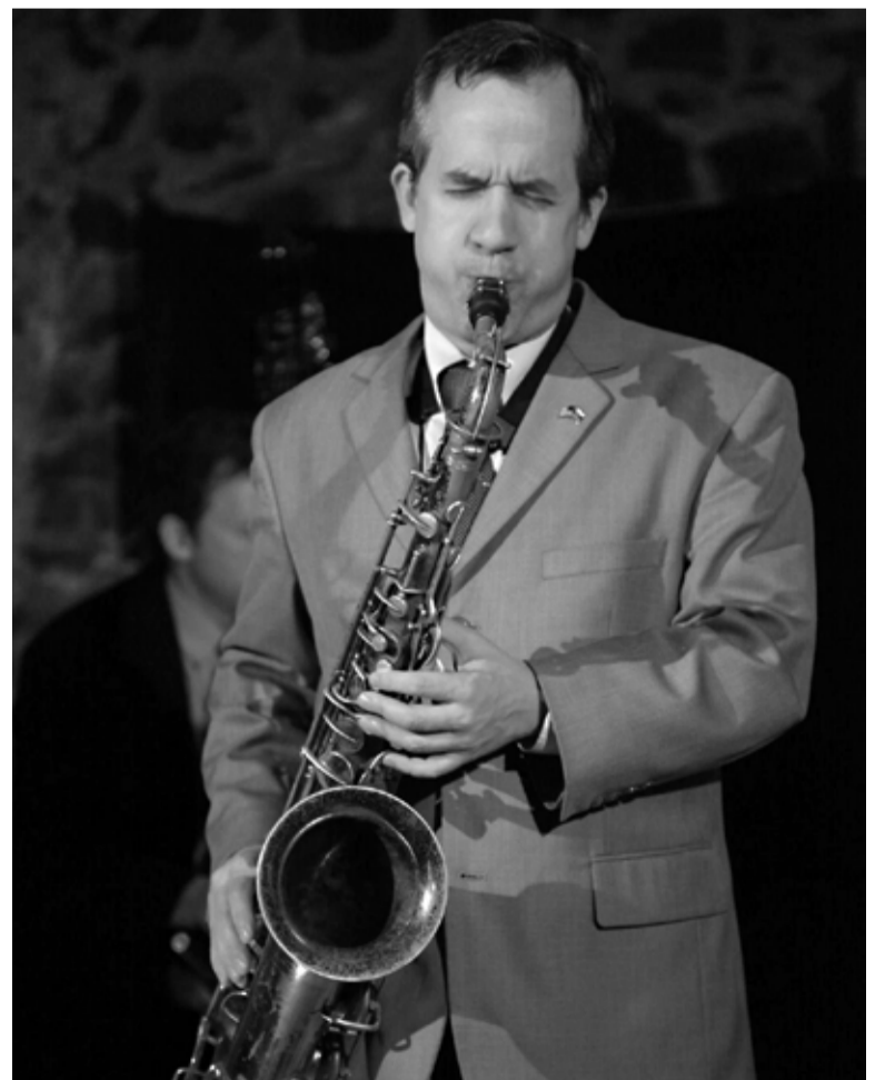
Frontman newyorskej jazzovej formácie Chris Byars quartet, ktorá zožala úspech v klube Labyrinth v nedeľu 27. marca.

Vstup voľný. Rezervácia stola pre 5 osôb: 1 €