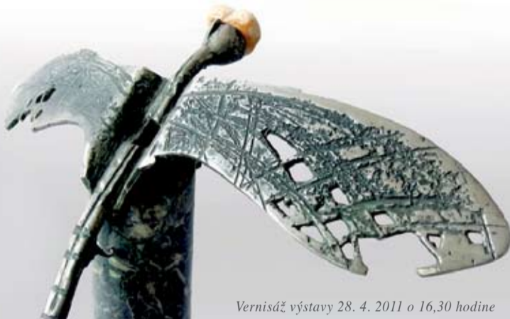
Vernisáž výstavy 28. 4. 2011 o 16,30 hodine

Výstavný kabinet expozície Líce a rub peňazí Štefánikovo nám. 11/21, Kremnica