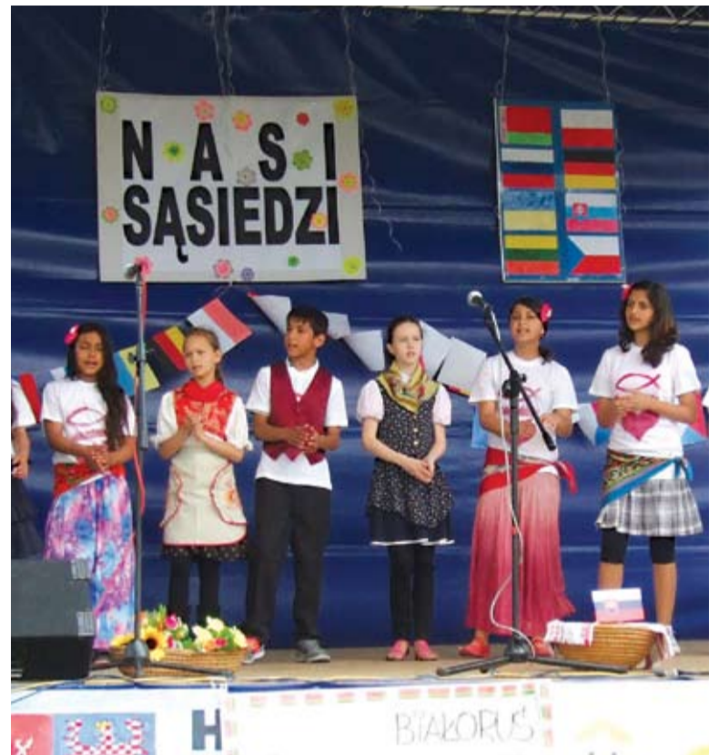
Záber z vystúpenia žiakov v prezentačnom umeleckom programe „Naši susedia“ vo Varšave 2010

K našim otázkam prikladáme naše odpovede na „3 x prečo?“ položené autorom v závere spo-