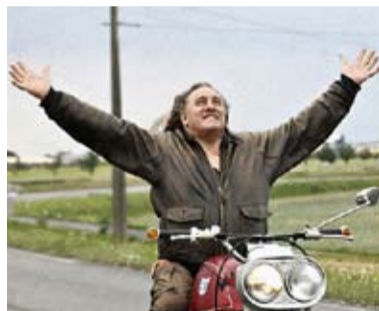
Vo filme Na Mamuta sa v najlepšej forme predstaví Gérard Depardieu

Gérard Depardieu nasadá na legendárnu motorku Mammut z roku 1973 a „rúti“ sa za bývalými zamestnávateľmi získať potvrdenia potrebné na vybavenie zaslúženej penzie. Lenže seniorský výlet sa čoskoro premení na bláznivé roadmovie plné bizarných stretnutí, spomienok na bývalú lásku a nečakaných zvrátov. Šesťdesiatnik Serge prežíva „Easy Rider“ svojho života so všetkým čo k tomu patrí. Road movie, Francúzsko, 2010, titulky CZ, MP 12, 92 min.