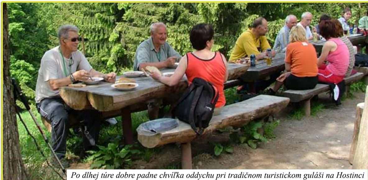
Po dlhej túre dobre padne chvíľka oddychu pri tradičnom turistickom guláši na Hostinci