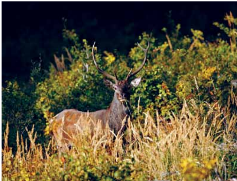
Od roku 2005 sa počet jeleňov v kremnických lesoch takmer zdvojnásobil.