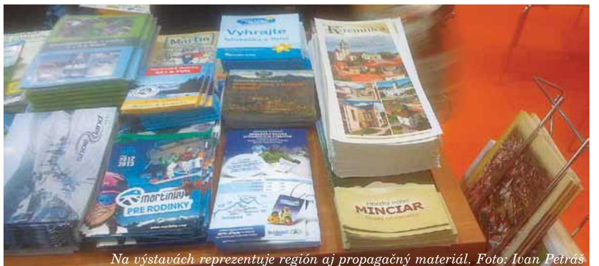
Na výstavách reprezentuje región aj propagačný materiál.

Keďže celkové stavebné náklady na výstavbu sú vyššie ako 80 850 €, nie je možné podať žiadosť o poskytnutie dotácie v zmysle zákona 443/2010 Z.z., čo poslanci na mestskom zastupiteľstve vzali na vedomie. Aj napriek tomu, bude mesto aj naďalej preverovať možnosti financovania nadstavby bytového domu č. 62/47 na Dolnej ulici v Kremnici.