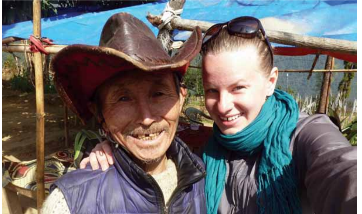
Pala – Láma budhistickej tradície Niyngma, správca najstaršej a najsvätejšej budhistickej svätyne najmenšieho indického štátu Sikkim, hlava tradičnej dedinky Lepčov – jedných z pôvodných obyvateľov oblasti, náš hosť a veľmi vzácny človek.

Po návrate prežívala kultúrny šok, tentokrát však zo Slovenska. Preplnené ulice plné usmiatych