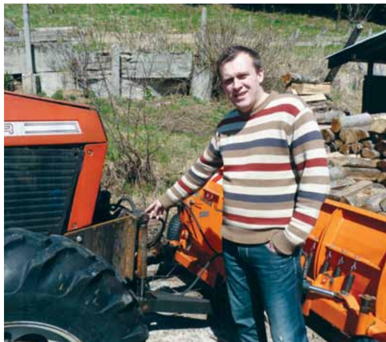
Traktor TS kúpili od Mestských lesov. Museli vymeniť celý motor a namontovali aj novú radlicu na odhŕňanie snehu.

Technické služby by pre zlepšenie zimnej údržby najviac po-