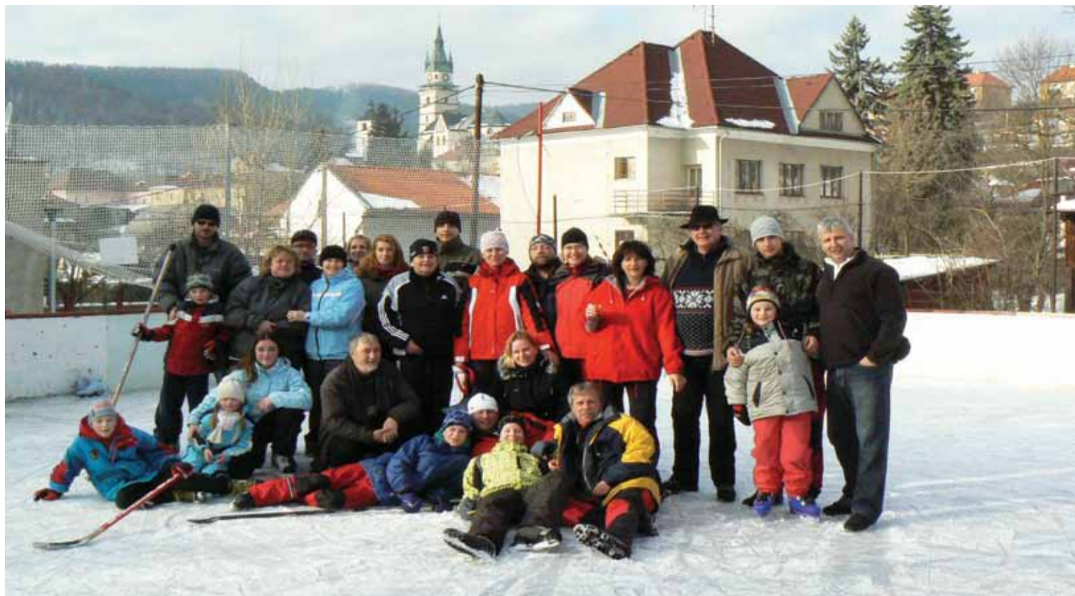
Rozlúčka s rokom na ľade s rodinami.

Občianske združenie Klub športu Kremnica má za sebou už 13. sezónu prevádzkovania prírodného klziska pre školy a širokú verejnosť mesta i okolia. Keď sme minulé korčuliarske sezóny označili ako výnimočné z rôznych dôvodov, táto mala tiež niekoľko zaujímavostí. Už prvé korčuľovanie pre verejnosť 10. decembra bolo pravdepodobne rekordom, čo sa týka začiatku sezóny. Tá trvala do 22. februára. Keď nás po minulé roky trápili oteplenia s úplnou stratou ľadu a následným začínaním od asfaltu až 4krát počas dvoch mesiacov, túto sezónu sme o ľad neprišli ani raz. Bolo to aj vďaka výdatnému a častému sneženiu a jeho využitiu pri zachovaní ľadovej plochy počas oteplenia. Kratšie, ale aj 10-dňové oteplenie s dažďom, 7krát počas sezóny môžeme tiež považovať za rekord. Celkovo bolo klzisko počas zimy v prevádzke 37 dní, uskutočnilo sa 50 verejných dvojhodinových korčuľovaní a 21 hokejových amatérskych stretnutí. Okrem tohto času mali možnosť bezplatne využívať klzisko aj všetky školy nášho mesta. Sezóna nebola dlhá, no napriek tomu bolo pri dozore a zabezpečení verejného korčuľovania odpra-