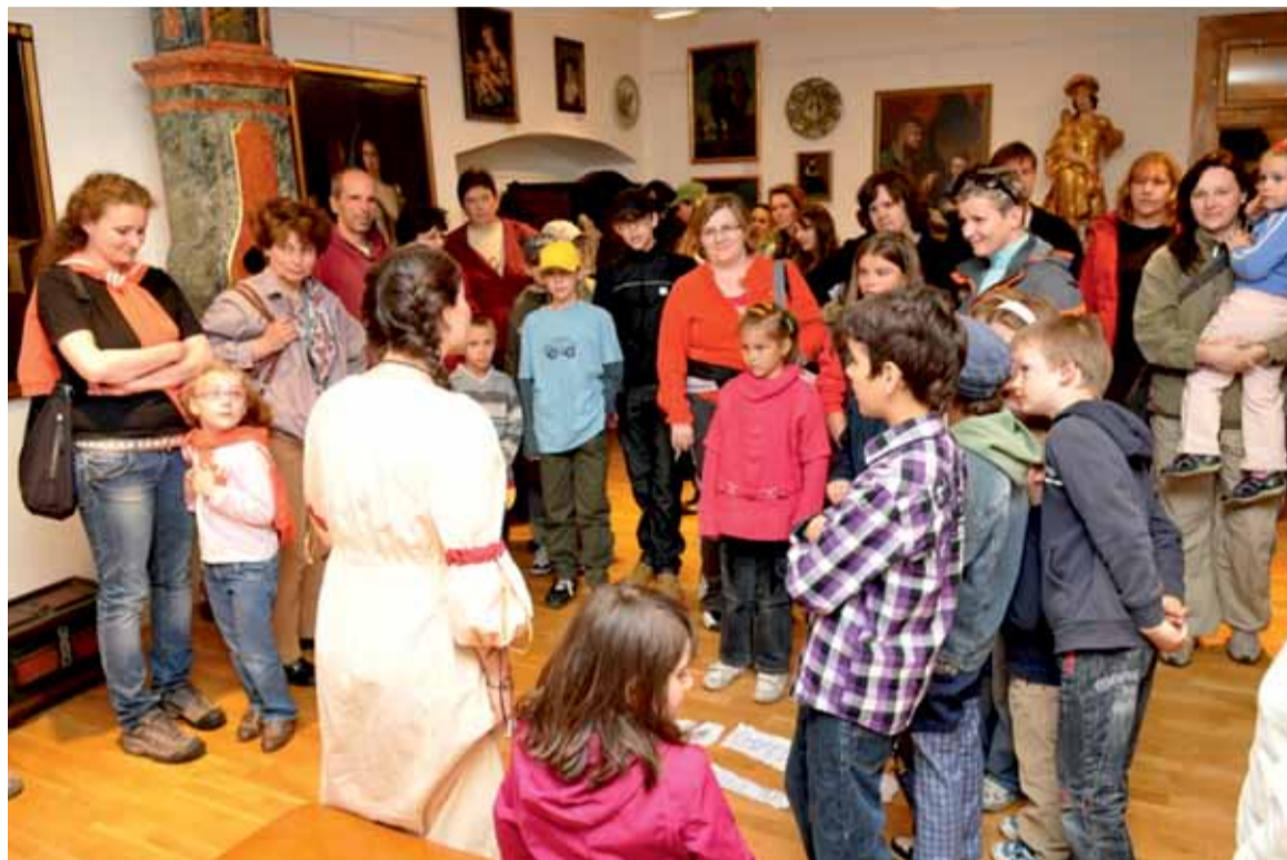
Noc múzeí v roku 2011