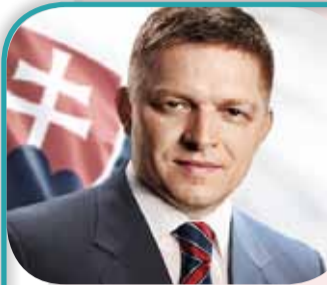
Robert Fico, SMER-SD

Pred prezidentskými voľbami sme kandidátom položili anketové otázky: Aký máte názor na zámer ťažby zlato-strieborných rúd v Kremnici? Budete sa v tejto veci angažovať ako prezident SR? Ak áno, ako? Tu sú odpovede najdôležitejších kandidátov, z ktorých jeden sa stane hlavou štátu.