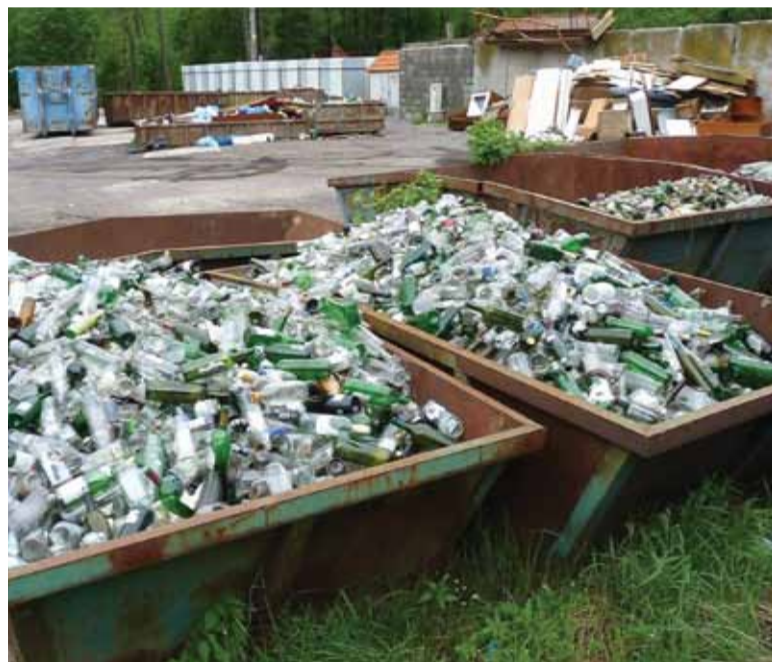
Kremničania majú k dispozícii zberný dvor na Hornej Vsi, kam môžu odpad odviezť zadarmo.