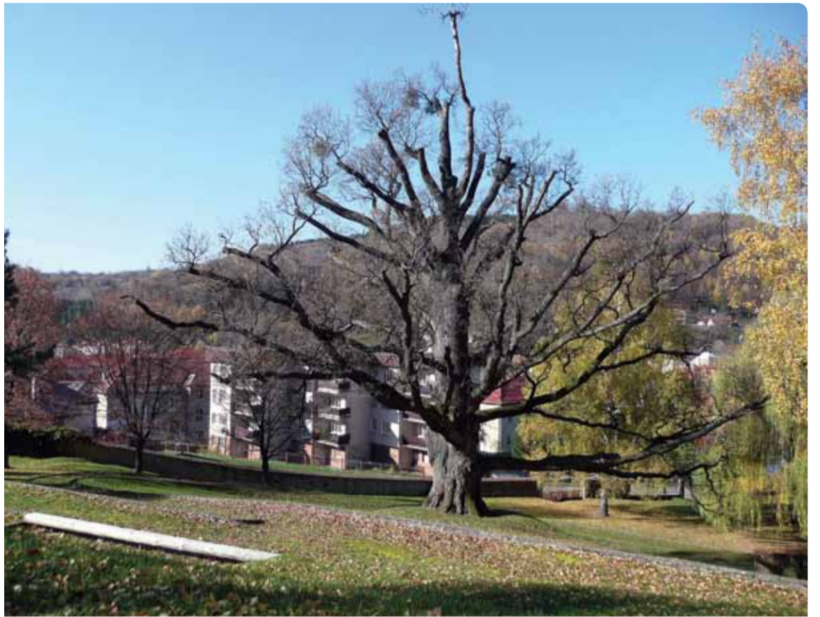
Slovensko 10169, Česko 8 211, Francúzsko 4989, Škótsko 1740, Írsko 1517, Wales 1093 a Taliansko 689 (51)

Počty hlasov: Bulharsko 77 526, Maďarsko 36 925, Poľsko 16 768,