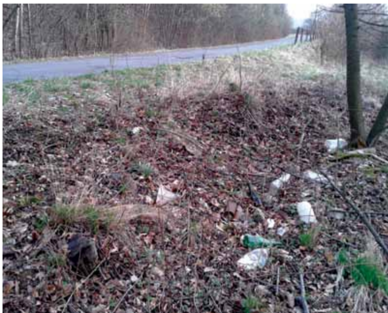
Popri ceste smerom na Nevoľné sa nájde všeličo...

Čierna skládka medzi Kremnicou a Nevoľným nezmizla ani po tom, čo odtiaľ technické služby vyviezli 12 ton odpadu. Podľa primátorky Kremnice ju vytvárajú občania Nevoľného, podľa starostu obce tam odpad vyvážajú Kremničania.