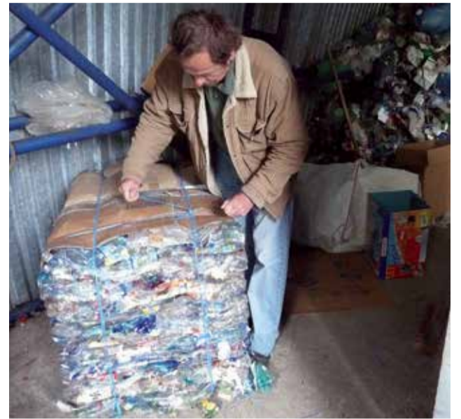
S lisovaním plastov začali v zbernom dvore v máji 2013.

Kontakt na oddelenie technických služieb: ts@kremnica.sk 045/ 6742 951