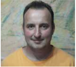
37 r., stavbár, ČSA 203/41, NEKA