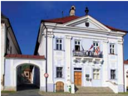
volebná miestnosť č. 3 – Mestský úrad

Volebná miestnosť – Mestské kultúrne stredisko, prízemie vľavo, Ulica Pavla Križku č. 391/6