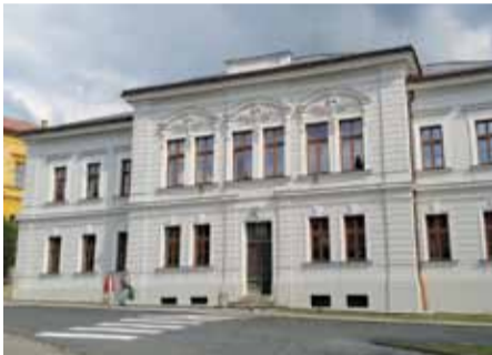
volebné miestnosti č. 2, 4, 5 – MsKS

Volebná miestnosť – Mestské kultúrne stredisko, prízemie vpravo, Ulica Pavla Križku č. 391/6