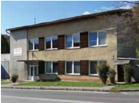
volebná miestnosť č. 1 – Hasičská zbrojnica

2. Miestami, kde budú môcť oprávnení občania hlasovať, sú nasledujúce miestnosti: