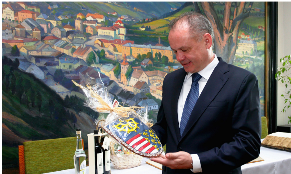
Prezident preberá dar od primátora Kremnice - medovník s motívom erbu mesta