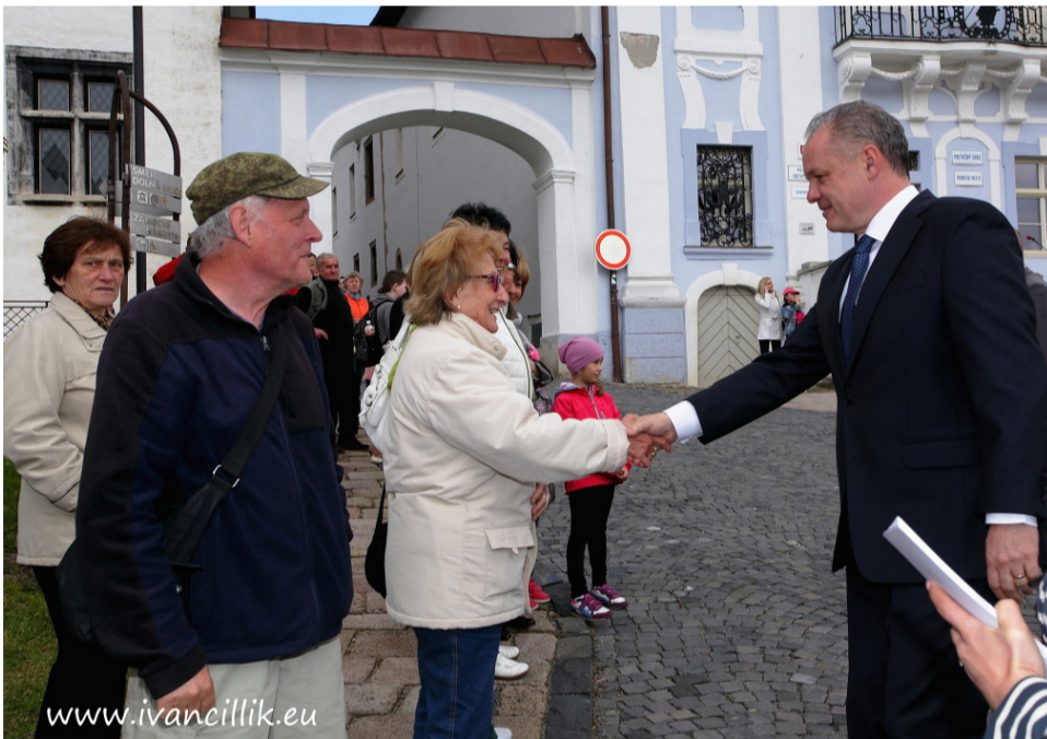
Prezident Andrej Kiska sa víta s občanmi Kremnice