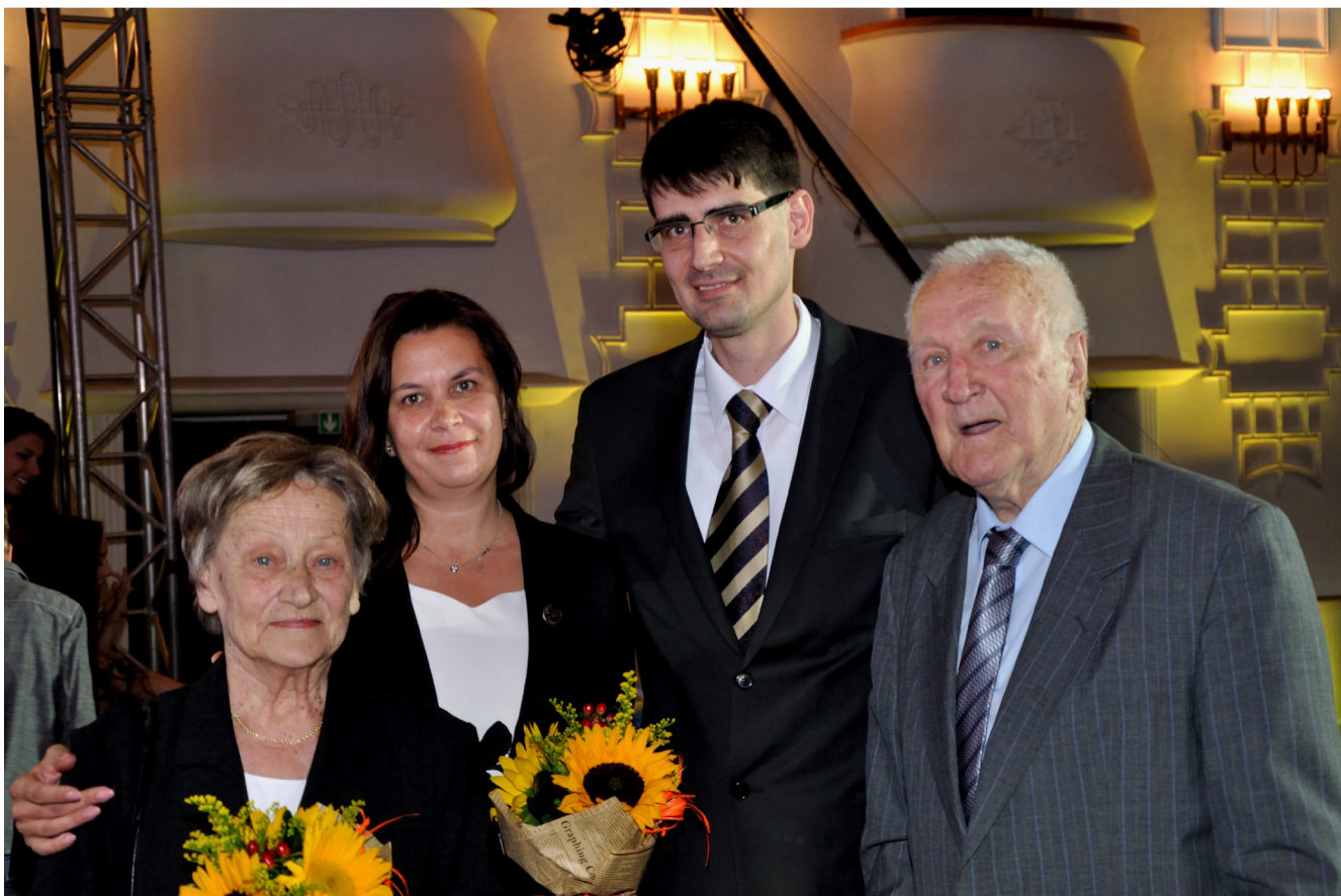
Pedagogický zbor SG