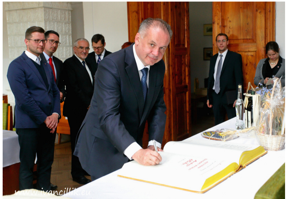
Prezident pri podpise kroniky mesta

V stredu 18. mája 2016 sa mohli Kremničania stretnúť s prezidentom Slovenskej republiky Andrejom Kiskom. Ten do nášho mesta zavítal v rámci výjazdu, ktorý sa v dopoludňajších hodinách začal oficiálnou návštevou Žiaru nad Hronom. Popoludní program prezidenta pokračoval na Mestskom úrade v Kremnici, kde sa stretol s vedením a poslancami mesta a prezrel si priestory radnice. Ešte predtým sa zvítal s občanmi, ktorí prezidenta čakali pred budovou radnice. Podľa tlačovej správy Kancelárie prezidenta SR bol ústrednou témou rozhovoru s vedením mesta cestovný ruch v Kremnici a jeho podpora. "Na rokovaní sa hovorilo o nedostupnosti rýchlej lekárskej zdravotnej starostlivosti, ktorá je