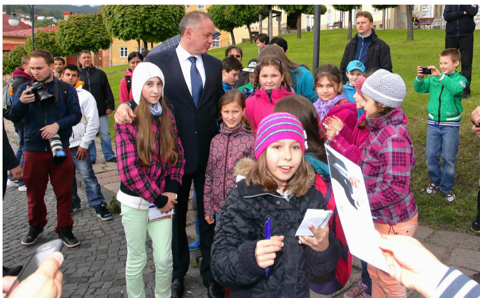
Prezident sa rozpráva s kremnickou mládežou

S prezidentom sa občania mesta mohli stretnúť pred Mestským úradom aj na Mestskom hrade. "Aj touto cestou sa chcem občanom mesta poďakovať, že o návštevu prezidenta prejavili záujem a čakali na neho pred úradom, ale i v zámockom areáli, kde sa s nimi zväčša aj osobne. Nejedna z nás si odniesol fotografiu s prezidentom," uvádza primátor mesta.