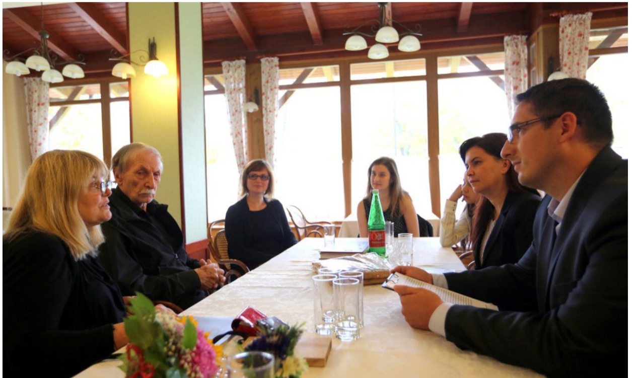
Kremnickí študenti a pedagógovia SG a SŠÚV sa stretli v Bratislave s L. Chudíkom pri príležitosti jeho 90. narodenín.