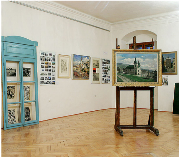
GALÉRIA MÚZEA A MEŠTIANSKY DOM

Okrem prehliadky dominanty hradu - Kostola sv. Kataríny - môžete vystúpiť do renesančnej veže, z ktorej sa môžete pokochať výhľadom na panorámu Kremnice a okolia.