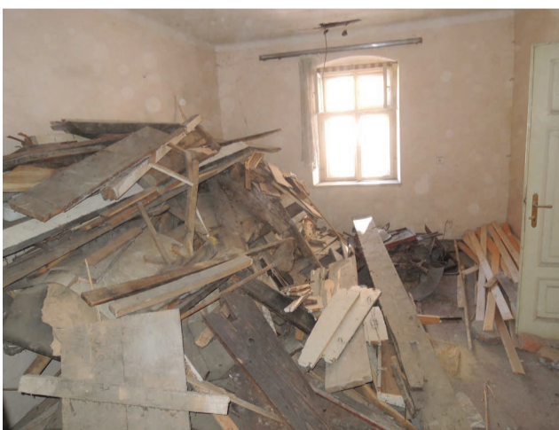
Foto pred a po rekonštrukcii